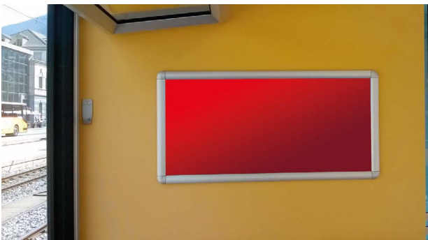
RailPoster 65 x 31 cm