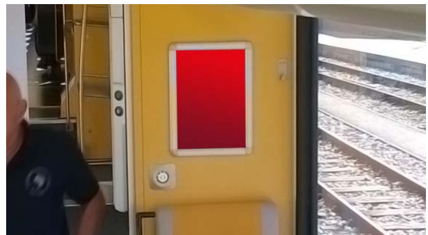
RailPosterMidi 25 x 35 cm