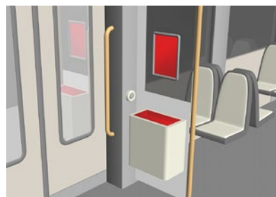
RailPosterMidi Promo Werbung mit Musterkorb Beste Platzierung im Einstiegsbereich sorgt für gute Sichtbarkeit.