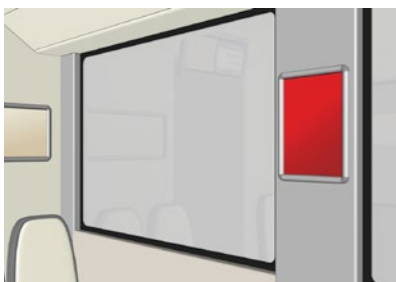
RailPosterMidi Auf Augenhöhe Attraktive Optik und Platzierung an frequentierten Positionen.